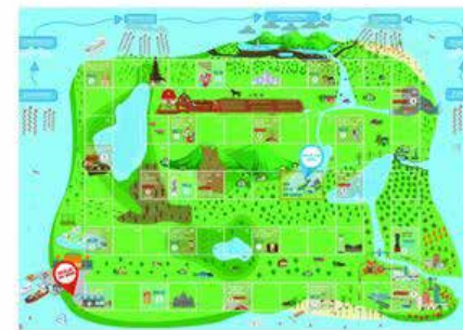
Papan Permainan MizuAdventure

Pada tahun 2021, Mizuiku menandatangani kerjasama dengan Kementerian Lingkungan Hidup & Kehutanan (KLHK RI) dengan fokus mendidik anak-anak di sekolah, kader organisasi, dan masyarakat sekitar tentang konservasi air. Hal ini menyelaraskan pelaksanaan Mizuiku dengan Gerakan Peduli dan Berbudaya Lingkungan Hidup di Sekolah Adiwiyata.