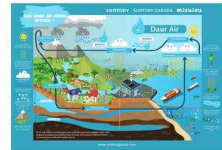
Poster Daur Air