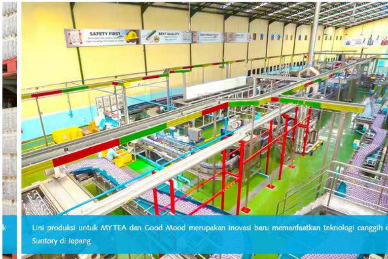
Lini produksi untuk MYTEA dan Good Mood merupakan inovasi baru memanfaatkan teknologi canggih dari Suntory di Jepang.